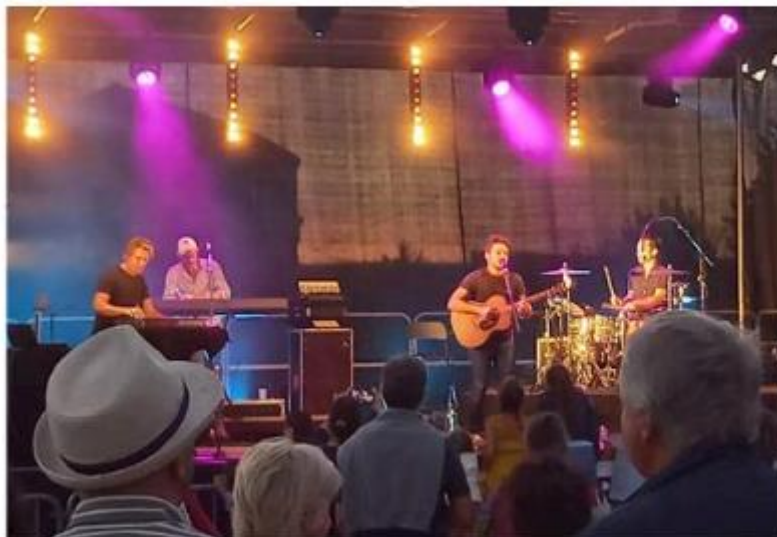
Le groupe stéphanois Alkabaya a mis de l'ambiance et fait danser Courçon