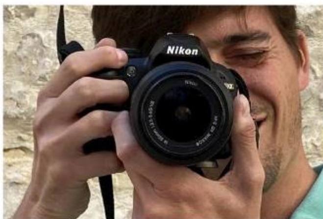
L'architecture de la commune, sa nature, ses festivités, ses habitants... sont au cœur du thème du concours photo

concours, il faut envoyer vos photos par mail entre le 1 er octobre et le 30 novembre à concoursphotocourcon@gmail.com ; ce mail doit impérativement contenir les photos bien évidemment, le nom et prénom, l'adresse et le téléphone du participant, une brève description des photos et l'autorisation de publication. Toute participation d'une personne au concours est bien entendu subordonnée à sa qualité d'auteur de la photographie.