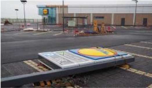
L'ouverture du hard discounter était programmée pour le 25 janvier