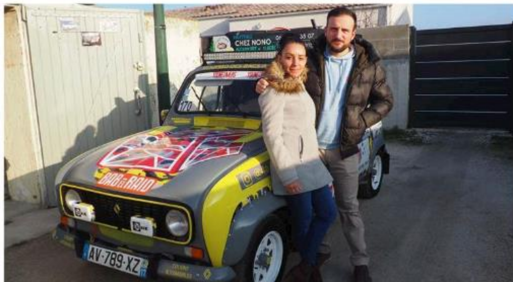
Le couple de Longevois est fin prêt pour le Bab el Raid