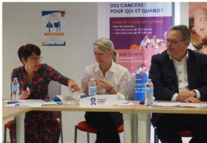
Les kits de dépistage sont gratuits

Une nouvelle campagne de dépistage du cancer colorectal vient d'être lancée par le Centre régional de coordination des dépistages des cancers de Nouvelle-Aquitaine (CRCDC-NA) et l'ensemble des acteurs de la santé. Elle est destinée aux femmes et hommes âgés de 50 à 74 ans ne présentant pas de symptômes apparents, ni de facteur de risque particulier. Ce mois de mars dédié à la prévention du cancer colorectal représente un temps fort pour renforcer l'idée que ce dépistage gratuit est simple et rapide grâce à un kit à se procurer chez son médecin, son pharmacien, ou bien encore en ligne. Il est recommandé de se faire dépister tous les deux ans. Depuis avril 2022, les pharmaciens sont habilités à délivrer des kits de dépistage. Ce sont 1 800 d'entre eux qui ont déjà été formés en Nouvelle-Aquitaine.