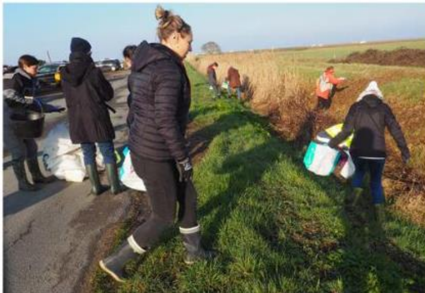
Le ramassage a été effectué à partir du port du Pavé en direction d'Esmandes