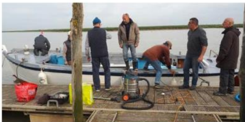
Chaque année avant de reprendre la mer, le Boucholeur subit une opération de carénage