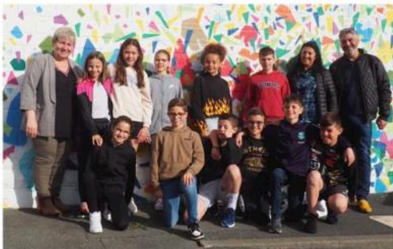
Prochainement toute l'équipe sera reçue à Paris par le Ministre de l'Éducation nationale