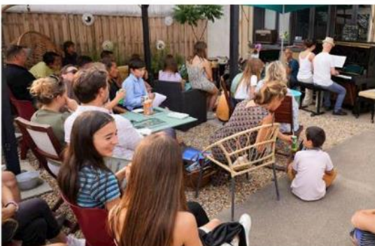
Entre 2019 et 2023, Point d'Orgue a perdu une trentaine d'élèves à cause de la crise sanitaire