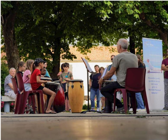
Récemment, les élèves se sont produits lors du nouveau marché de Saint-Jean de Saint-Jean