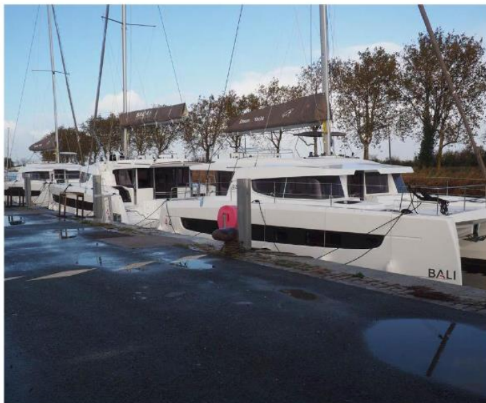
La volonté des élus est que Marans devienne un vrai pôle économique autour du nautisme