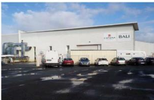
La zone industrielle de la Pénissière affiche complet et Catana ne peut plus s'agrandir