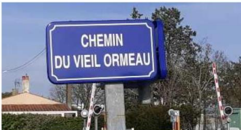
Cette démarche permet de rendre plus lisibles certaines adresses. F. A.

Un agent, recruté pour cette mission, doit se rendre sur le terrain pour vérifier des voies existantes, identifier celles à créer, numéroté des habitations ou encore rencontrer les administrés concernés. Après présentation du projet en conseil municipal pour une déli-