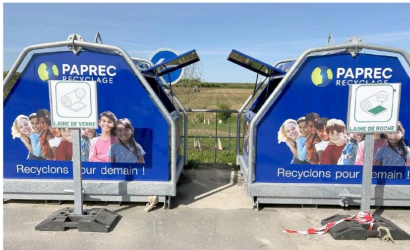
Deux bennes de tri pour la laine de verre et de roche ont été installées au centre de valorisation de Surgères

Les jeux et jouets, les articles de bricolage et de jardinage ainsi que les produits et matériaux de construction du secteur du bâtiment, s'inscrivent dans de nouvelles filières de tri. Depuis le 1 er mars, les territoires d'Aunis et de Saintonge équiperont leurs déchetteries.