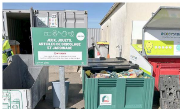
Box de tri pour les jeux, jouets et articles de bricolage et jardinage