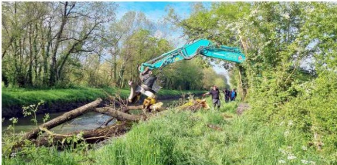
Travaux de désencombrement du canal de la Vieille Autise

Vous l'avez sans doute remarqué, l'automne 2023 et l'hiver qui a suivi ont été particulièrement humide. Plusieurs épisodes de crues se sont succédé sur le bassin de la Sèvre niortaise, avec de nombreuses tempêtes et forts coups de vent. Ce qui n'a pas été sans conséquence. « Des chutes et des amoncellements d'arbres, de branches ou de souches ont encombré le réseau hydraulique domanial au sein du marais poitevin » , indique l'Institution Interdépartementale du Bassin de la Sèvre Niortaise (IIBSN). Ainsi, les agents de l'IIBSN et des entreprises spécialisées sont intervenus tout au long de l'hiver et interviennent encore ponctuellement pour réaliser des travaux de désencombrement ou d'élagage sur l'ensemble du domaine public fluvial de la Sèvre niortaise et de ses affluents principaux : le Mignon et l'Autise. « La voie principale de la Sèvre niortaise est aujourd'hui dégagée et réouverte à la navigation depuis le mois de mars. Les secteurs fortement fréquentés entre Niort et Coulon ont également bénéficié de travaux de désencombrement conséquents » , note l'IIBSN. Aujourd'hui, la quasi-totalité des circuits de navigation sont accessibles et sécurisés. Si les conditions météorologiques le permettent, la navigation des bateaux et des barques devrait pouvoir reprendre normalement au mois de mai sur l'ensemble du domaine public fluvial.